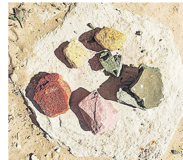
Statt Farbe aus der Tube: Gesteinsproben, aus denen Malerei wird.